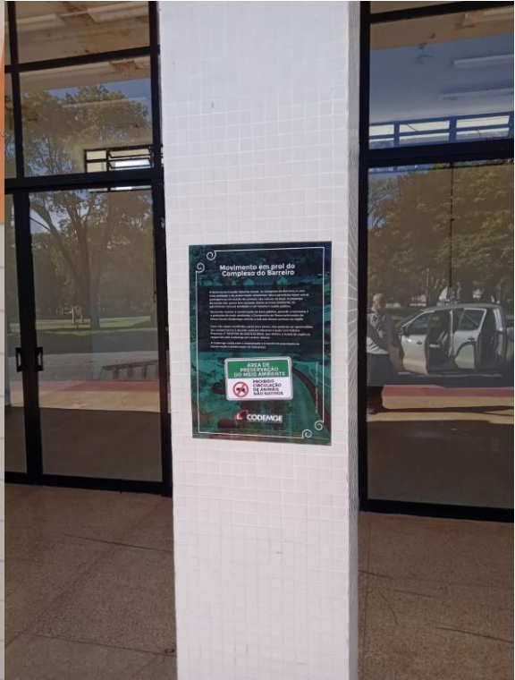
GUARITA ENTRADA TAUÁ GRANDE HOTEL