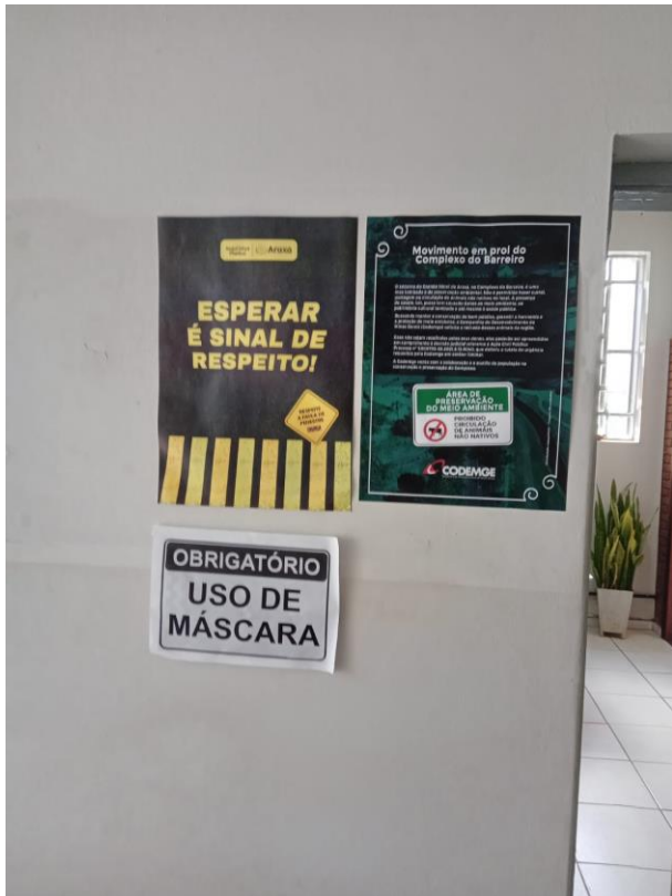
ENTRADA DA EMATER