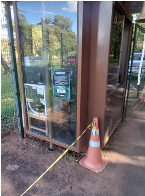
SALA DE ESPERA DETRAN